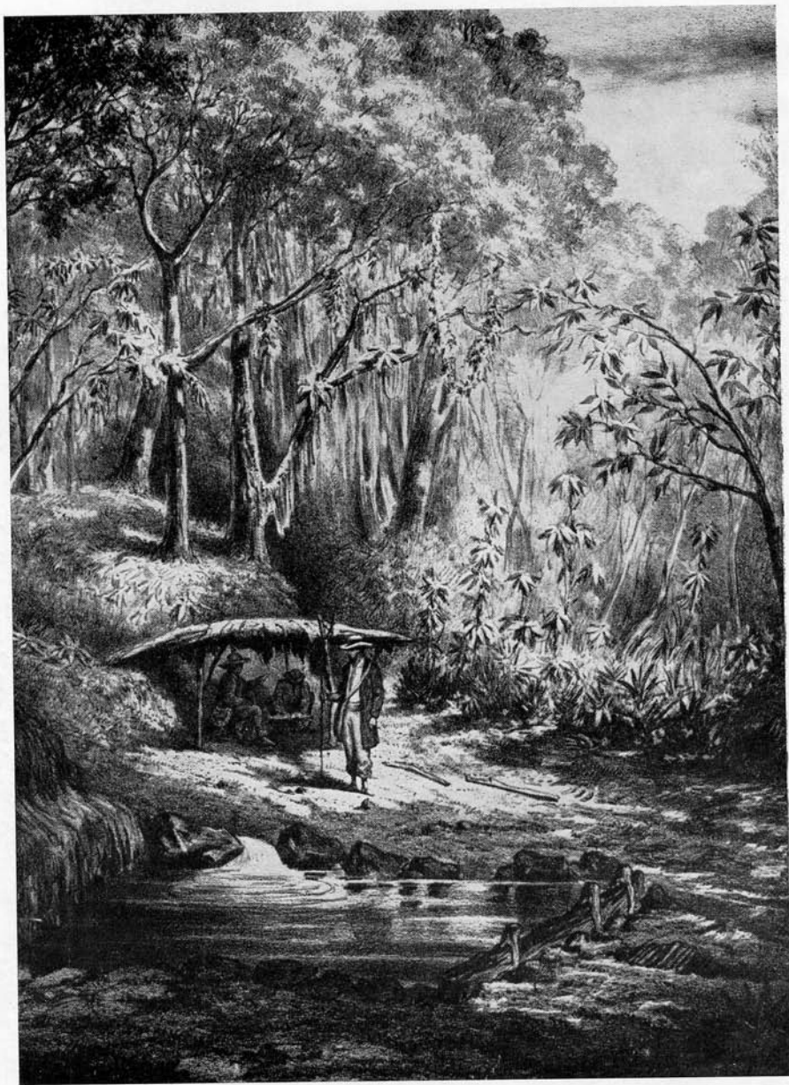
Les Bains Jaunes, sur le chemin de la Soufrière, gravure extr. de l'album, La Guadeloupe pittoresque , publié par Armand Budan en 1863.